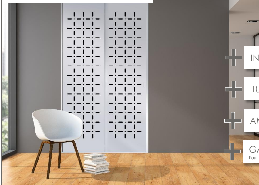
Portes de placard coulissantes modèle DOORISSIME bi-matière motif Daisy® avec Plexiglass® noir – 2 Vantaux de 800x2450mm. Coloris blanc.